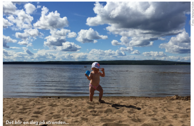
Det blir en dag på stranden...

vägs ände, Tjuvholmsundet, och Luleå skärgård. Rakt framför dig har du nu Sandön, den närmaste och största ön i Luleå skärgård. Det finns en liten strand till höger där man också kan bada och sitta på båtar som kör förbi. På tillbakavägen kan du följa Lulviksvägen drygt 3 kilometer, ta höger på Nordkalottvägen som du följer till Norrsågsvägen. Följ Norrsågsvägen tills den tar slut och en cykelväg tar vid. Cykelvägen fortsätter en liten bit, sen måste du ut på bilvägen cirka 200 meter. Vid pizzerian på höger sida kör du upp på cykelvägen igen, den kommer att ta dig över Bergnälsbron och tillbaka till stan.