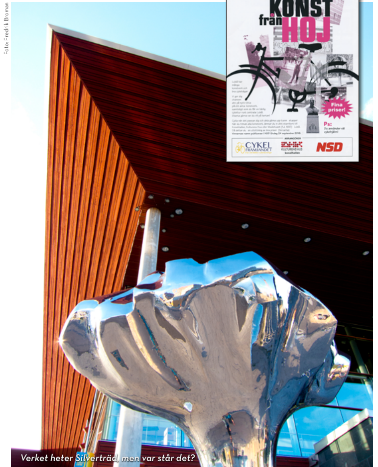
Verket heter Silverträdet, men var står det?

Konst från hoj! Upplev Luleås offentliga konst från cykeln. Du får en härlig tur runt centrala Luleå. Karta och startblankett hämtar du i Konsthallens reception eller på Luleå turistcenter i Kulturens hus.