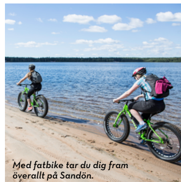
Med fatbike tar du dig fram överallt på Sandön.

Packa badkläder, solkräm och matsäck eller ät på Klubbvikens restaurang (öppet sommarsäsongen). Den här turen passar bra för dig som vill ha roligt på cykeln, köra off road på skogsstigar och stränder och samtidigt ha tid för sol och bad. Mot en mindre avgift kan du - i mån av plats - ta med cykeln på turbåten från Södra hamn. Info: lapponia.se . Hoppa av vid Klubbvikens havsbad och välj om du vill följa havssidan runt udden, eller om du vill börja med att utforska de olika stigarna som tar dig till andra sidan. Här finns mycket att utforska! För denna tur är fatbikes att föredra då det finns många sandiga partier.