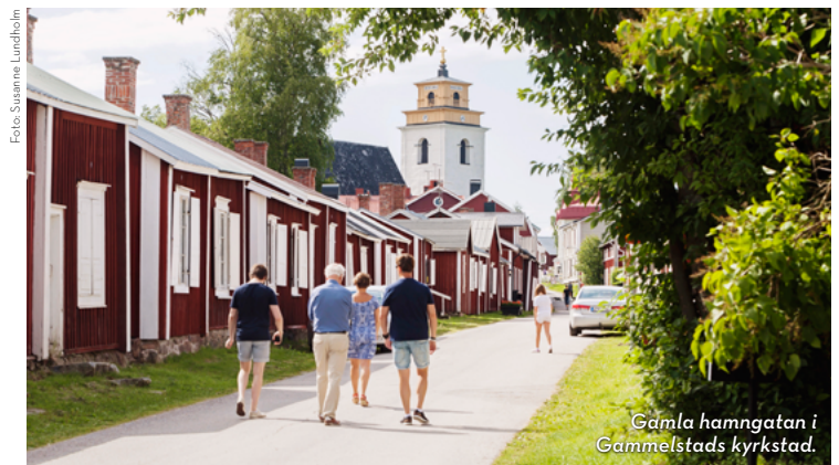
Gamla hamngatan i Gammelstads kyrkstad.

Cykla ut från stan norrut över vägbanken, följ cykelstigen längs älven tills du kommer fram till Storheden. Väl på Storheden, sväng upp på cykelbron över Storhedsvägen och fortsätt längs cykelbanan till nästa avtagsväg till höger. Cykla genom Tuvåkra industriområde fram till bron över järnvägen. Ta höger, cykla över bron så