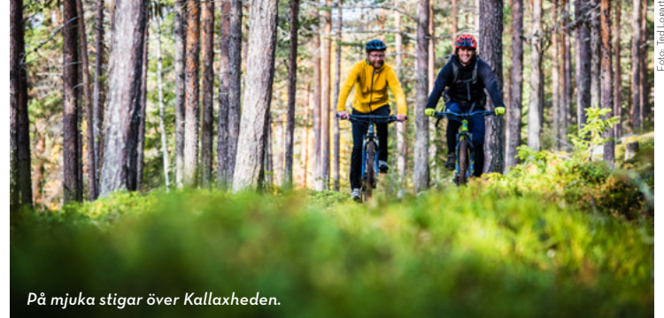
På mjuka stigar över Kallaxheden.

När du cyklar tillbaka så kan du fortsätta längs cykelvägen tills du kommer till en tunnel som går under bilvägen, fortsatt rakt fram, in på industriområdet. Följ Norrsågsvägen tills den tar slut och en cykelväg tar vid. Cykelvägen fortsätter en liten bit, sen måste du ut på bilvägen cirka 200 meter. Vid pizzerian på höger sida kör du upp på cykelvägen igen, den kommer att ta dig över Bergnälsbron och tillbaka till stan.