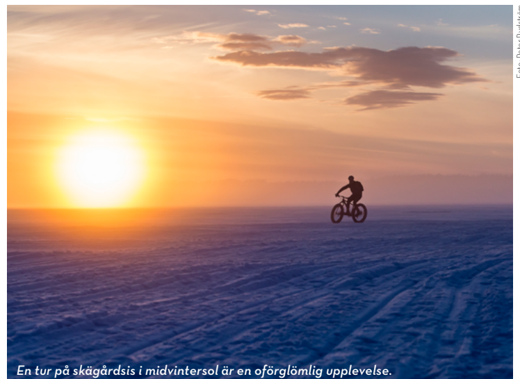
En tur på skärgårdsis i midvintersol är en oförglömlig upplevelse.