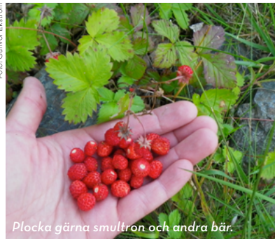
Plocka gärna smultron och andra bär.

FISKE I havet är fisket fritt, men det finns regler för hur, när och vad man får fiska. I sjöar och älvar krävs som regel fiskekort.