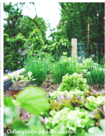
Odlarglädje på kolonilotten.

Är du sugen på en längre tur med lätt cykling så rekommenderar vi en tur till Lövsjärn, med slutdestination Lövsjärns hamn och porten ut till Luleå skärgård. Du kommer bland annat att cykla förbi den grönskande oasen Hertsöns koloniområde.