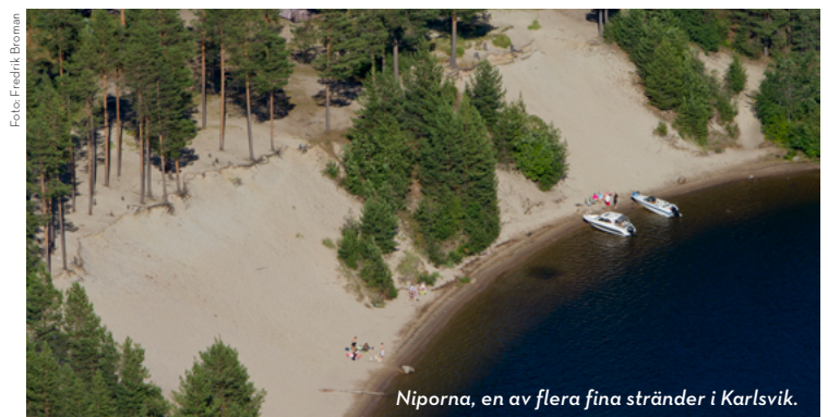
Niporna, en av flera fina stränder i Karlsvik.

Mer om Karlsvik: karlsvik.se Järnvägsmuseet: nbjvm.se