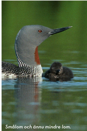
Smålom och ännu mindre lom.