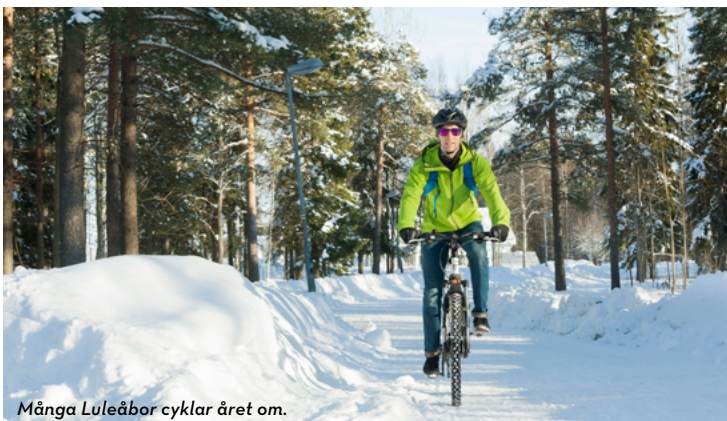
Många Luleåbor cyklar året om.