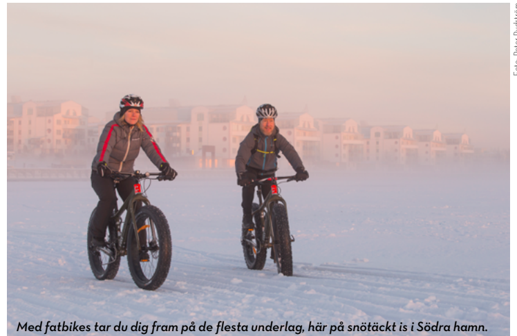
Med fatbikes tar du dig fram på de flesta underlag, här på snötäckt is i Södra hamn.

CYKLING PÅ ISVÄGAR I LULEÅ SKÄRGÅRD För dig som vill cykla en längre sträcka på isen så finns möjlighet att cykla på någon av de isvägar i Luleå skärgård som, beroende på isens bärighet, hålls öppna för biltrafik varje vinter. Isvägar finns till Hindersön, Storbrändön, Sandön och Junkön. På några av öarna i skärgården finns stugor att hyra året runt. Kontakta Luleå turistcenter för uthyrning av stugorna samt information och rekommendationer om säkerhet för isvägarna, eller läs mer på lulea.se/skargard . Guideföretagen kan också, vid gynnsamma förhållanden, erbjuda dig vinteräventyr bortom isvägarna, läs mer på visitlulea.se .